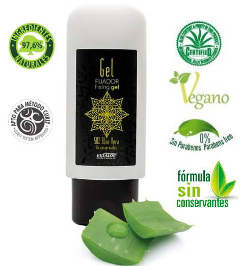
Envase de 200 ml (ref.1070)

¡Todo lo que tu cabello necesita para lucir una bonita melena saludable!