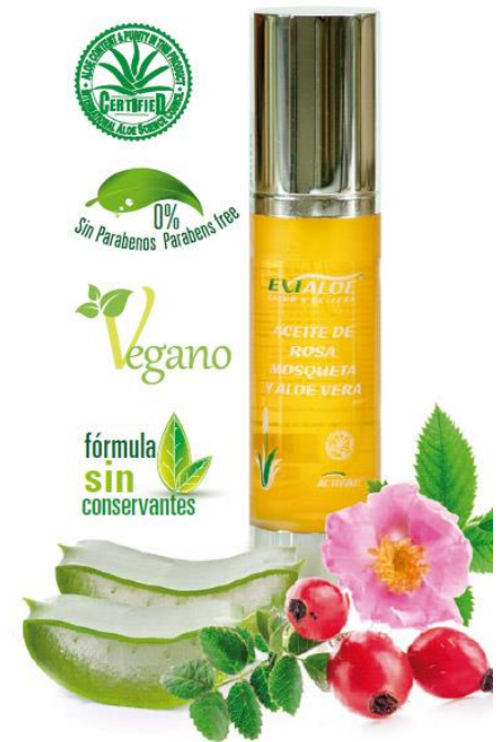
Envase de 50 ml (ref.1150)